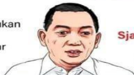
Sjafrie Sjamsoeddin Menteri Pertahanan

Perubahan UU TNI yang diajukan DPR diperlukan sebagai landasan hukum yang lebih jelas terhadap peran TNI pada tugas selain perang tanpa melanggar prinsip demokrasi dan supremasi sipil."