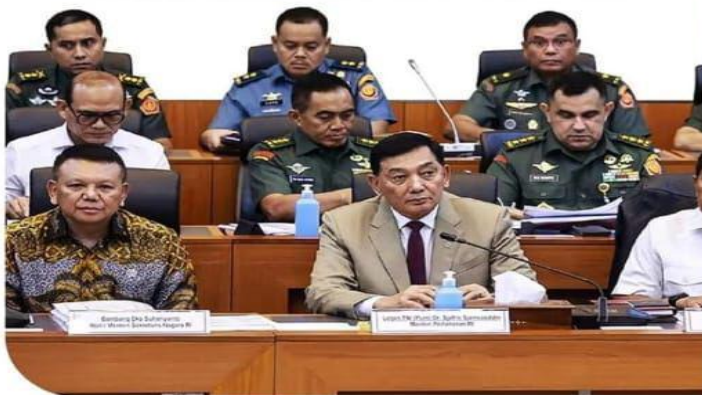
Data Kementerian Pertahanan (Kemenhan), 11 Maret 2025